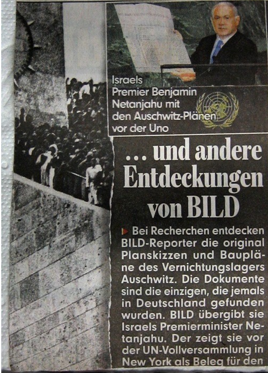
Israels Premier Benjamin Netanjahu mit den Auschwitz-Plänen vor der Uno